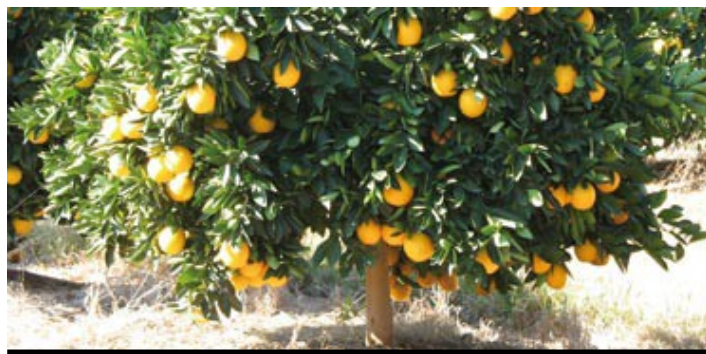
Árbol con fruta