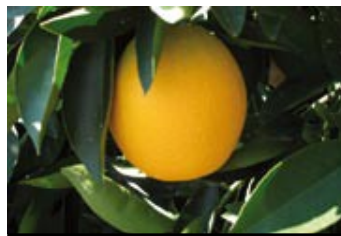
Forma de la hoja