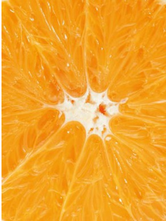
Glen Ora Late Navel