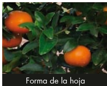
Forma de la hoja