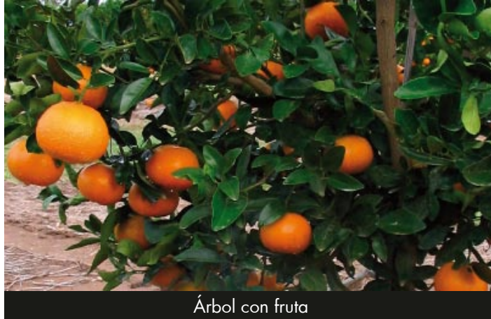
Árbol con fruta