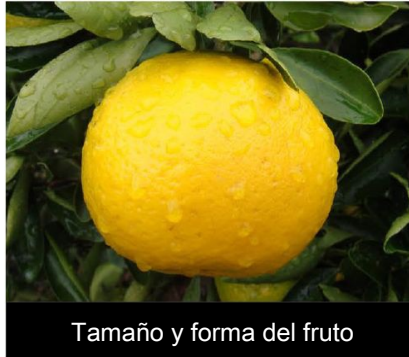
Tamaño y forma del fruto