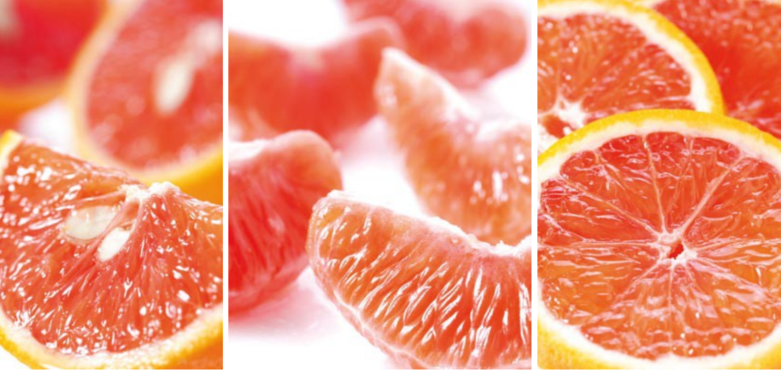
Ruby Late Maturing Valencia