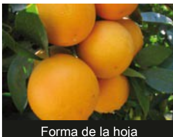
Forma de la hoja