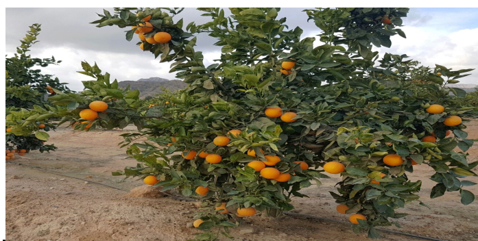
Árbol con fruta