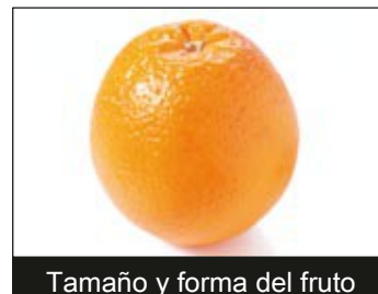
Tamaño y forma del fruto